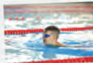
▲ Niños en clases de natación.